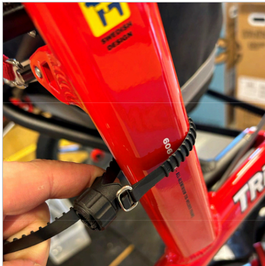
② ストラップをフレームチューブに巻き付けてホルダーに通します。