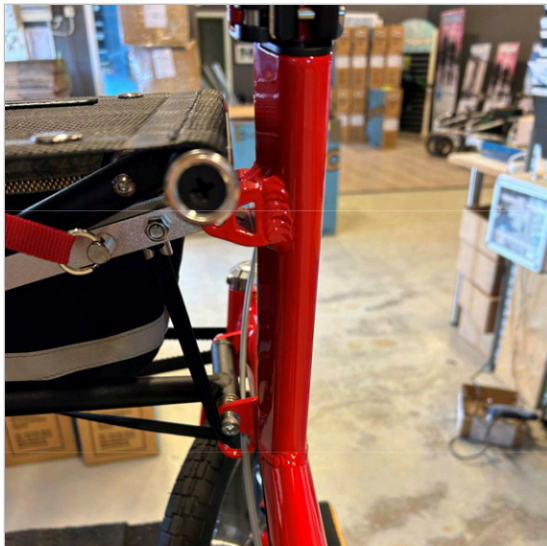
① ボトルホルダーの組み立て場所（RまたはL）。