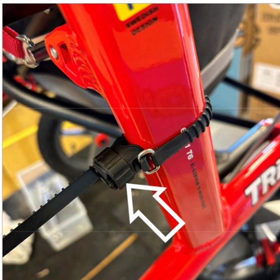
③ ストラップをしっかりと引っ張り、ナットを時計回りに回してストラップを締めます。