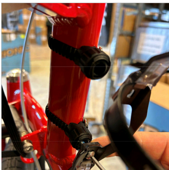
⑦ ボトルホルダーを2本のネジで取り付けます。ボトルホルダーの「開口部」が外側を向くようにしてください。