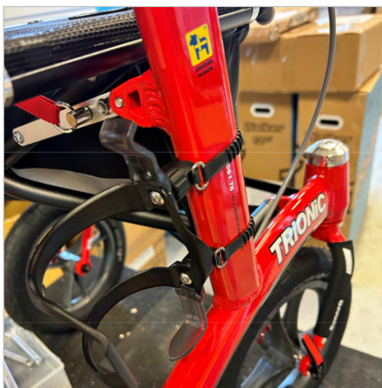
⑧ ボトルホルダーがフレームに取り付けられ、側面からボトルを入れて外側に取り外すようになりました。