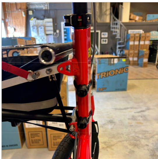
⑥ 2つのホルダーがフレームチューブに正しく組み立てられました。